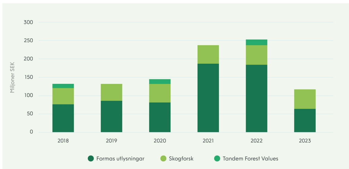
Figur 1. Formas finansiering av skogsrelaterad forskning över åren 2018–2023.

Formas utlysningar i stapeln visar medel för finansierade skogsrelaterade projekt i Formas forskarinitierade och tematiska utlysningar. Tematiska utlysningar med fokus på skogsområdet hölls år 2021 och 2022, därav den högre finansieringen i Formas utlysningar de åren. Den delen av stapeln representerad av Skogforsk innefattar Formas statliga ramanslag till Skogforsk på cirka 50 Mkr per år. Tandem Forest Values visar de Formas-medel som under åren 2018, 2020, och 2022 gått till tematiska utlysningar inom Tandem Forest Values, vilket är ett bilateralt forskningssamarbete mellan Sverige och Finland.