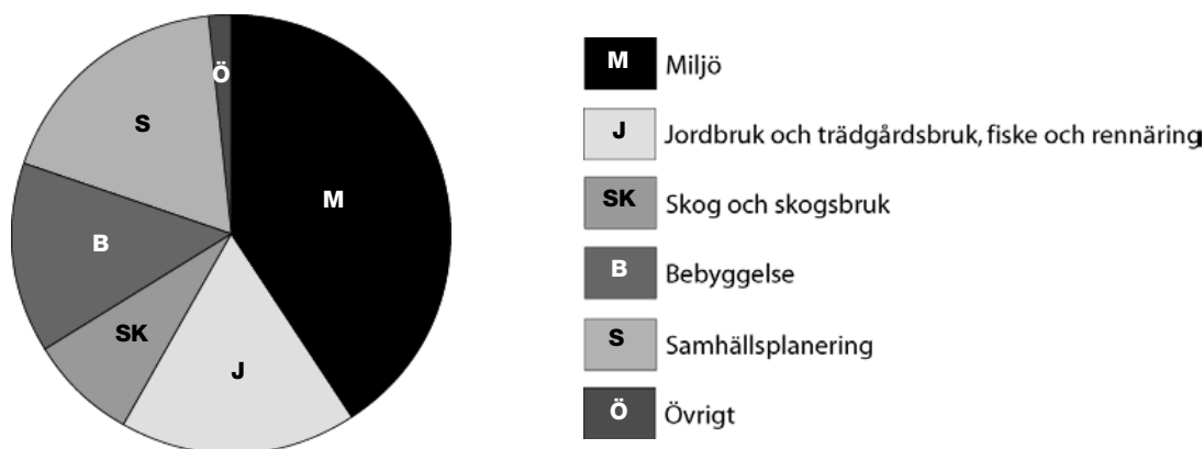
Utlysta medel som beviljats 2002 för åren 2002-2005 fördelade per programområden

Under 2002 utlystes och beviljades preliminärt totalt 445,2 miljoner kronor. Dessa fördelades på programområden enligt diagrammet nedan.